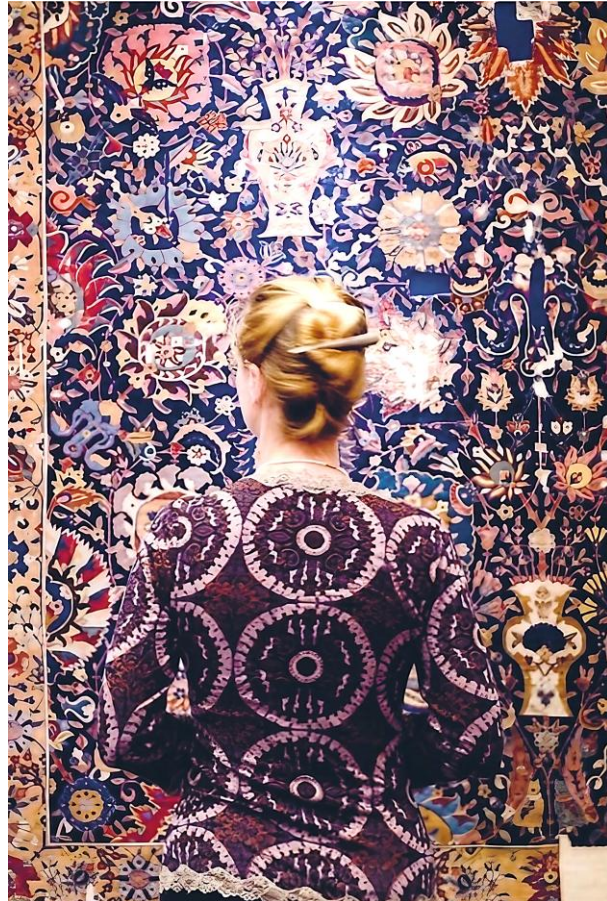
© Stefan Draschen: Zufälle im Museum, Hatje Canz Verlag, 2019